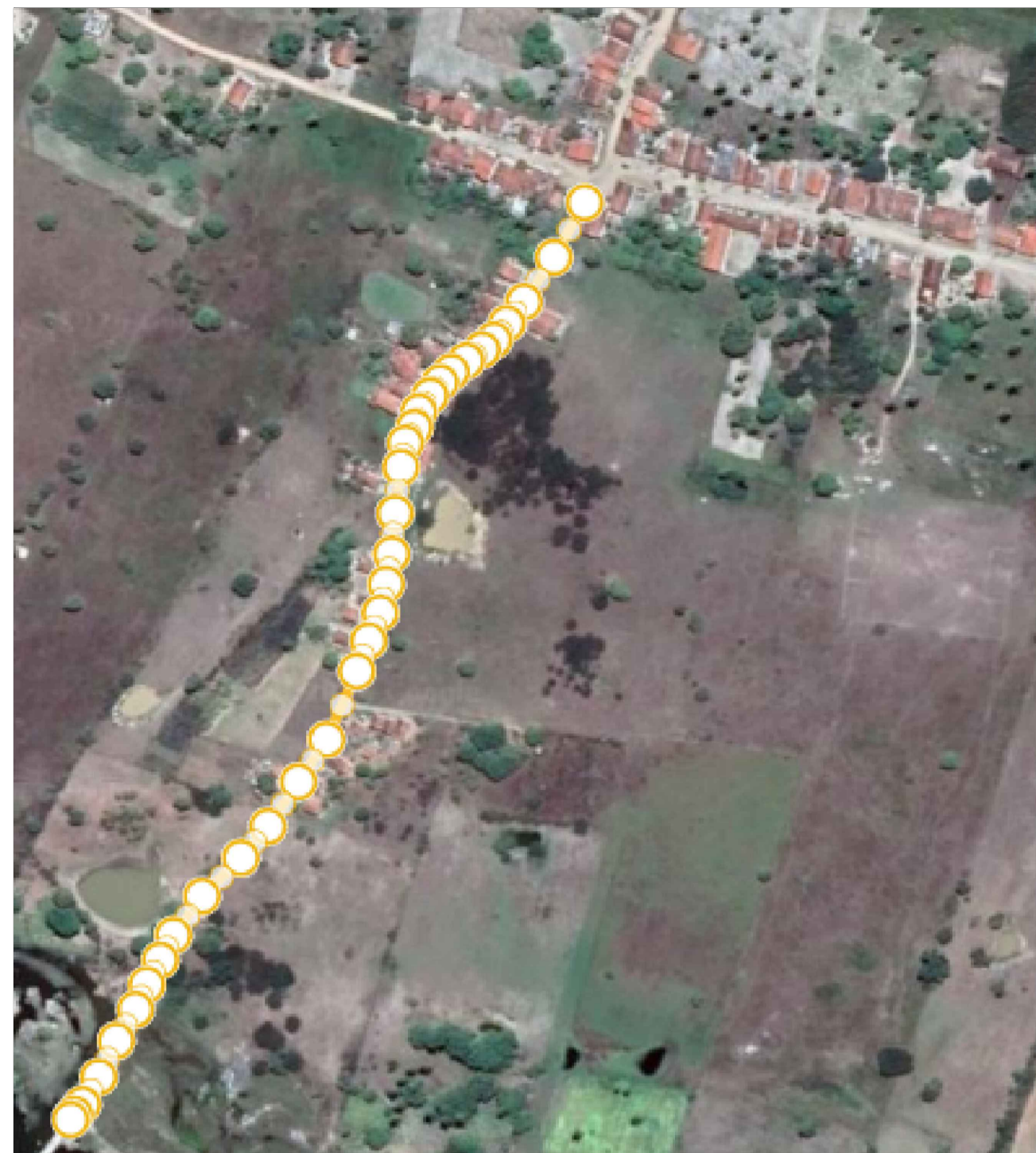
MAPA DO TRECHO SEM ESCALA